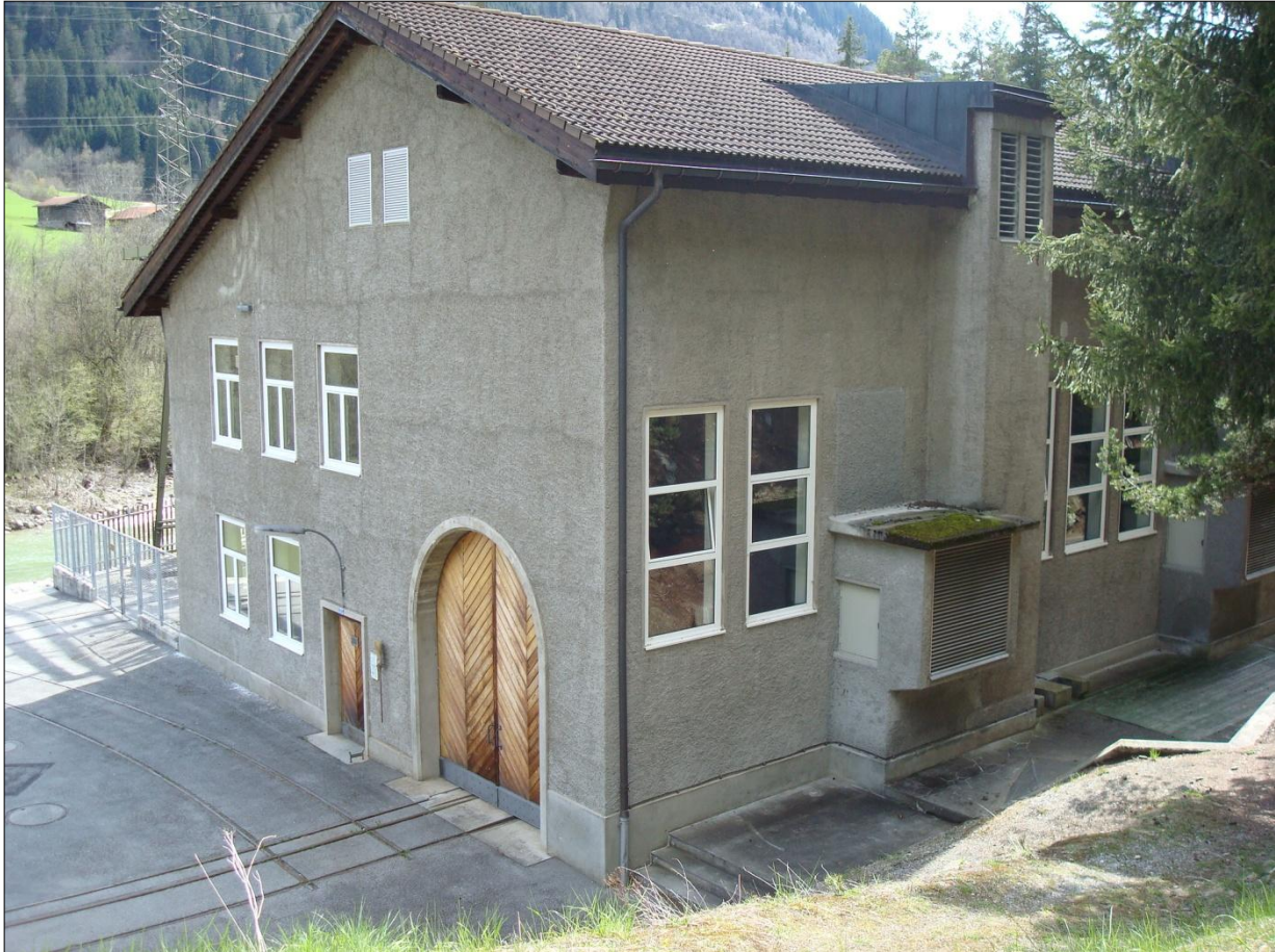
la centrala davart encunter damaun