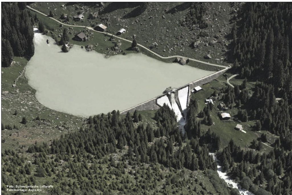
lag da Barcuns cun alzament dil mir per 5 m