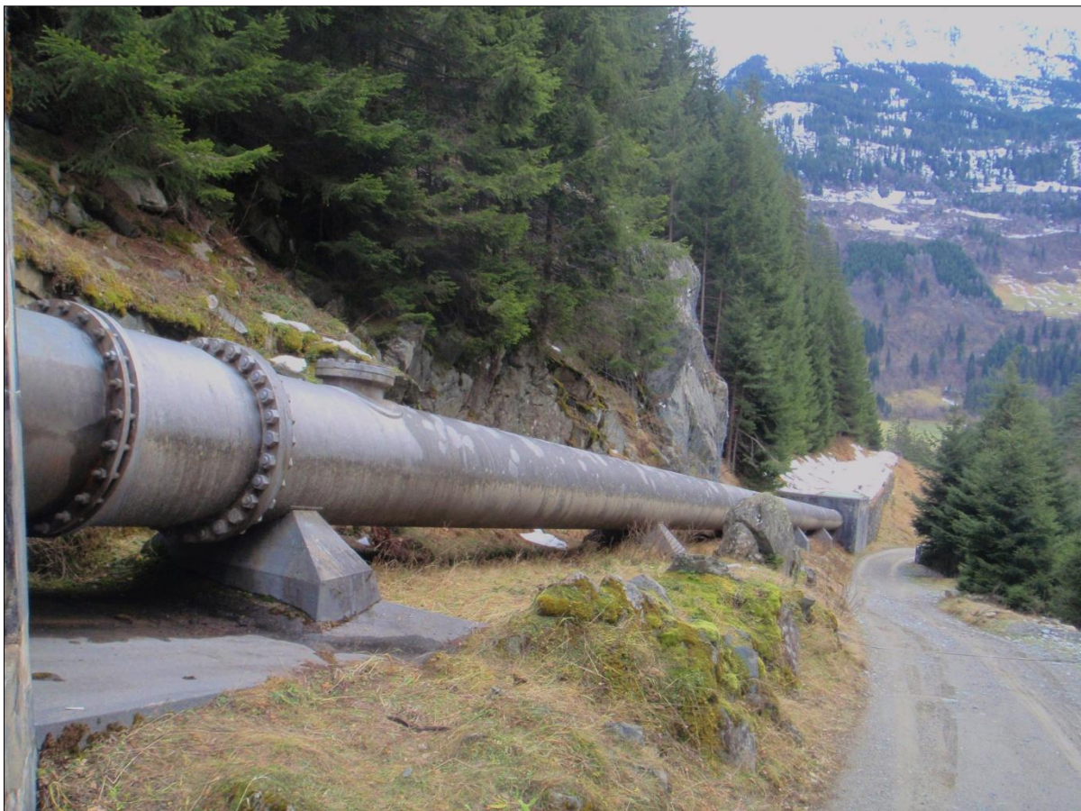
lingia da pressiun e via el Malpass

Igl access actual sut il Malpass satisfà buca allas pretensiuns per in access segir durant il temps da baghegiar. L'avertura dil plazzal a Barcuns e la construcziun dalla lingia da pressiun pretendan in access segir e carrabels cun autos da vitgira, pia ina via cun dameins pendenza.