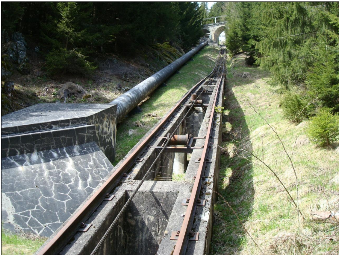
lingia da pressiun gest sur la centrala

La lingia da pressiun actuala meina l'aua naven dil lag a Barcuns entochen ella centrala sper il Rein. Gest suenter il lag flessegia l'aua tras ina stolla cun ina lunghezia da ca. 85 m ed in diameter dad 1850 mm entochen tier il baghetg cul scludider dalla lingia. Naven da leu meina ina lingia da fier cun ina lunghezia da 2145 m ed in diameter denter 900 e 1100 mm, per gronda part sur tiara, l'aua entochen ella centrala. La scadenza brutta maximala dall'ovra existenta munta 396.25 m. La lingia da pressiun orda fier ei gia sils onns e sto vegnir remplazzada.