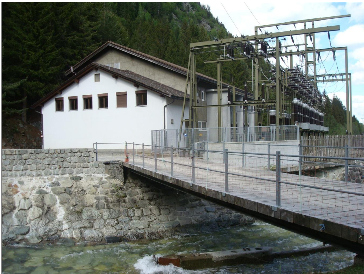
centrala davart encunter sera

Il baghetg ei vegnius completaus igl onn 1983 cun in baghetg annex da vart encunter sera e cuntegn denter auter la stanza da commando ed ulteriuras stanzas pil menaschi.