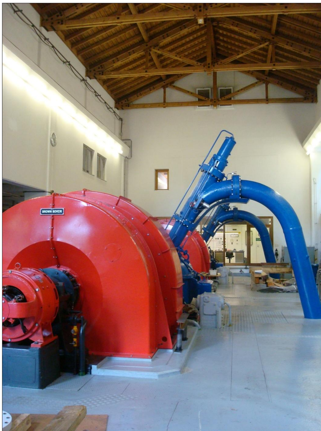
centrala cun sala da maschinas

Adattaziuns ein previdas mo egl intern dil baghetg, aschia che la cumparsa anoviars resta pli u meins sco tochen dacheu.