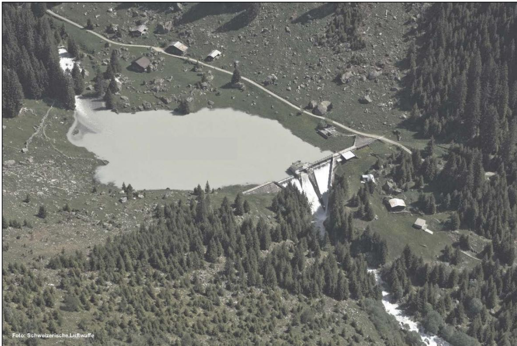
lag da Barcuns 2010

Il mir a Barcuns duei vegnir alzaus per 5 m, quei ch'augmenta il volumen dil lag da 115'000 a 210'000 m 3 . Il mir niev ei 33.5 m aults. Ils meins october tochen mars cun pouca aua sa quella vegnir accumulada el lag da fermada durant las uras da tariffa bassa, vul dir la notg e la sonda e dumengia, per lu vegnir turbinada il temps da tariffa aulta. Durant quels meins sa il nivel dil lag sesbassar e sesalzar enteifer ina jamna per tochen 20 m. Ils ulteriurs meins cun bia aua vegn quella turbinada directamein, aschia ch'ei dat lu mo minimalis svaris dil nivel dil lag. La quantitat maximala d'aua tschaffada per la producziun vegn augmentada dad oz 4.0 sin niev 7.0 m 3 /s. A basa da quei quantum d'aua, che sa vegnir utilisaus cumpleinamein mo durant rodond 45 dis ad onn, vegnan las turbinas ed ils generaturs sco era ils ulteriurs indrezs dalla centrala dimensiunai.