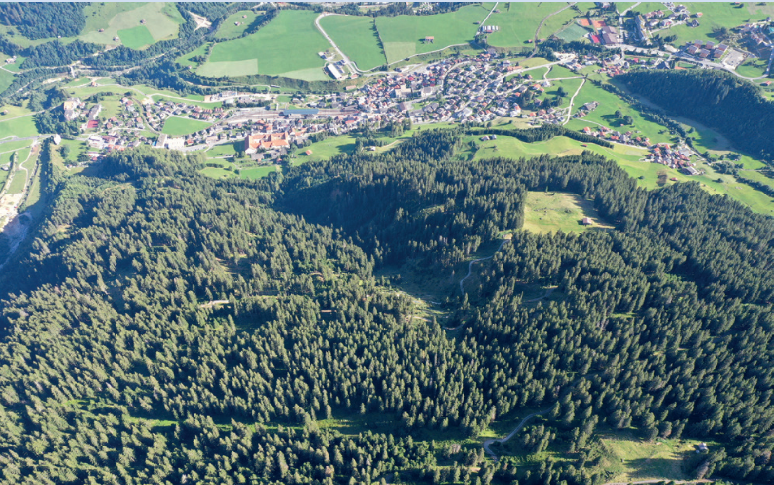
Igl Uaul dil Run sur il vitg da Mustér.

– La via per liung dalla Val da Cuoz cun las sbuccadas viers Prau Sura resp. Plaunca Su fuorma ina stretga dependenza per la meglieraziun funsila.