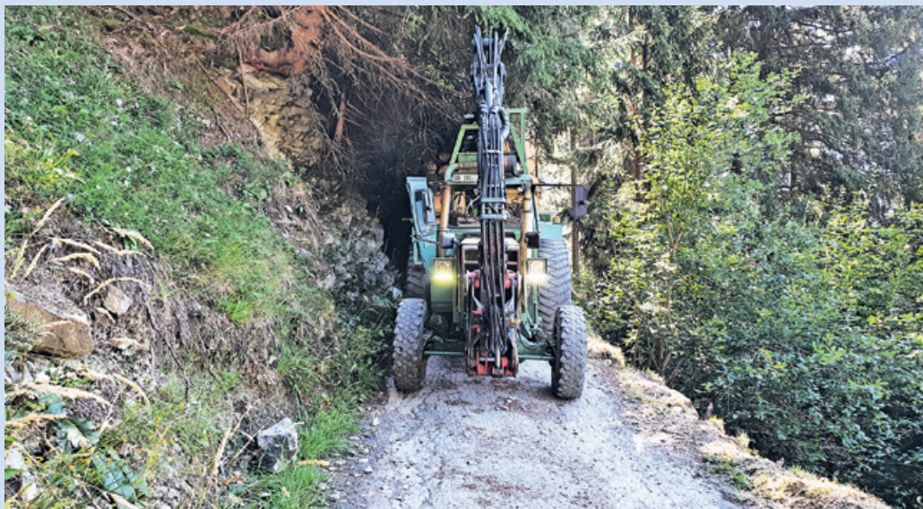
La via forestala existenta dil Run ei fetg stretga.

* Summa per l'emprema etappa da tschun onns, dil reminent denter 20% e 30% dils cuosts restonts.