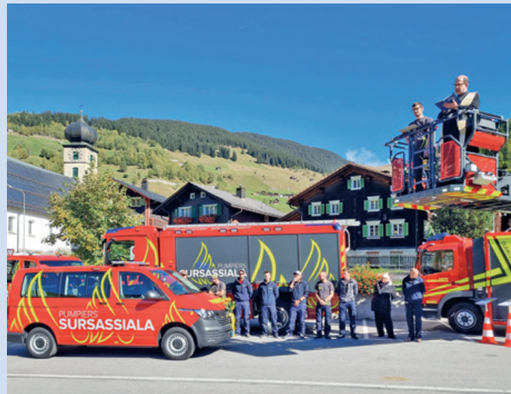
Surdada dil vehichel da protecziun da flad «Martin» a Curaglia igl october 2021.

La repartiziun dils cuosts per quei survetsch ha meinsvart menau a discussiuns el cussegl da vischnaunca a caschun dalla tractaziun dil preventiv. Actualmein vegnan ils cuosts reparti sin fundament d'ina clav da repartiziun che sebase sil diember da habitonts e la valeta da tut ils edificis tenor schazetg dalla GVG enteifer mintga vischnaunca. La clav da repartiziun s'presenta actualmein sco suonda: