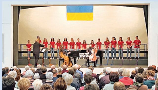
In dils concerts da beneficenza en favur dils fugitivs ella Sala Peter Kaiser a Mustér.

En concordanza cullas instanzas communalas e cantunalas ha ei giu num tschercar soluziuns per la scolarisaziun dils affons quest atun. Igl ei lu semussau spert ch'igl ei buca pusseivel d'instruir tuts a Mustér. Aschia ha il cantun procurau per habitaziuns per la gronda part dallas famiglias el contuorn da Cuera. Leu san ils affons era vegnir scolarisai successivamein. Entochen miez uost ha la gronda part dallas famiglias dalla gruppa bandunau la part su dalla Surselva. Entginas restan cheu. Con ditg negin che sa, mo la finamira da tuts fugitivs ei da saver returnar beinspert en lur patria.