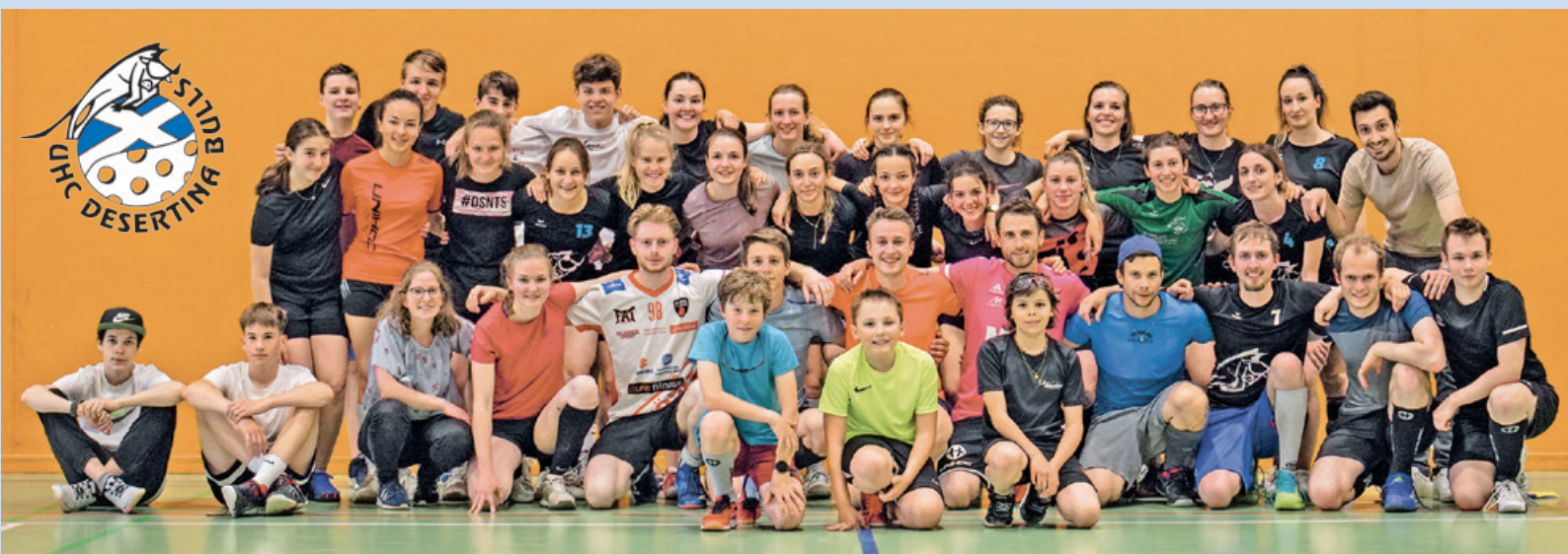
Giugaduras e giugadurs dils Desertina Bulls.