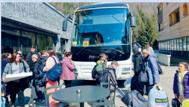
Miez mars ein biebein 60 fugitivs ucrains – surtut dunnas ed affons – arrivai a Mustér.

Il 24 da fevrer 2022 ein truppas russas marschadas ell'Ucraina. Dapi lu regia uiera en parts dalla tiara, surtut egl ost. Milliuns persunas, oravontut dunnas ed affons, han fatg la fuigia dapi lu. Biars ein semess sin via en direcziun vest e han per part era avisau e la fin finala contonschiu la Svizra. Ladinamein suenter che l'uiara ei rutta ora ein seformadas gruppaziuns ell'entira Svizra che han organisau accziuns per rimnar daners, rauba e victualias pils pertuccai. Aschia era a Mustér.