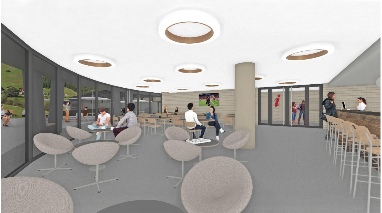
Il center da visitaders cun gronda vetrificaziun e bia spazi pils hosps dil CSC.