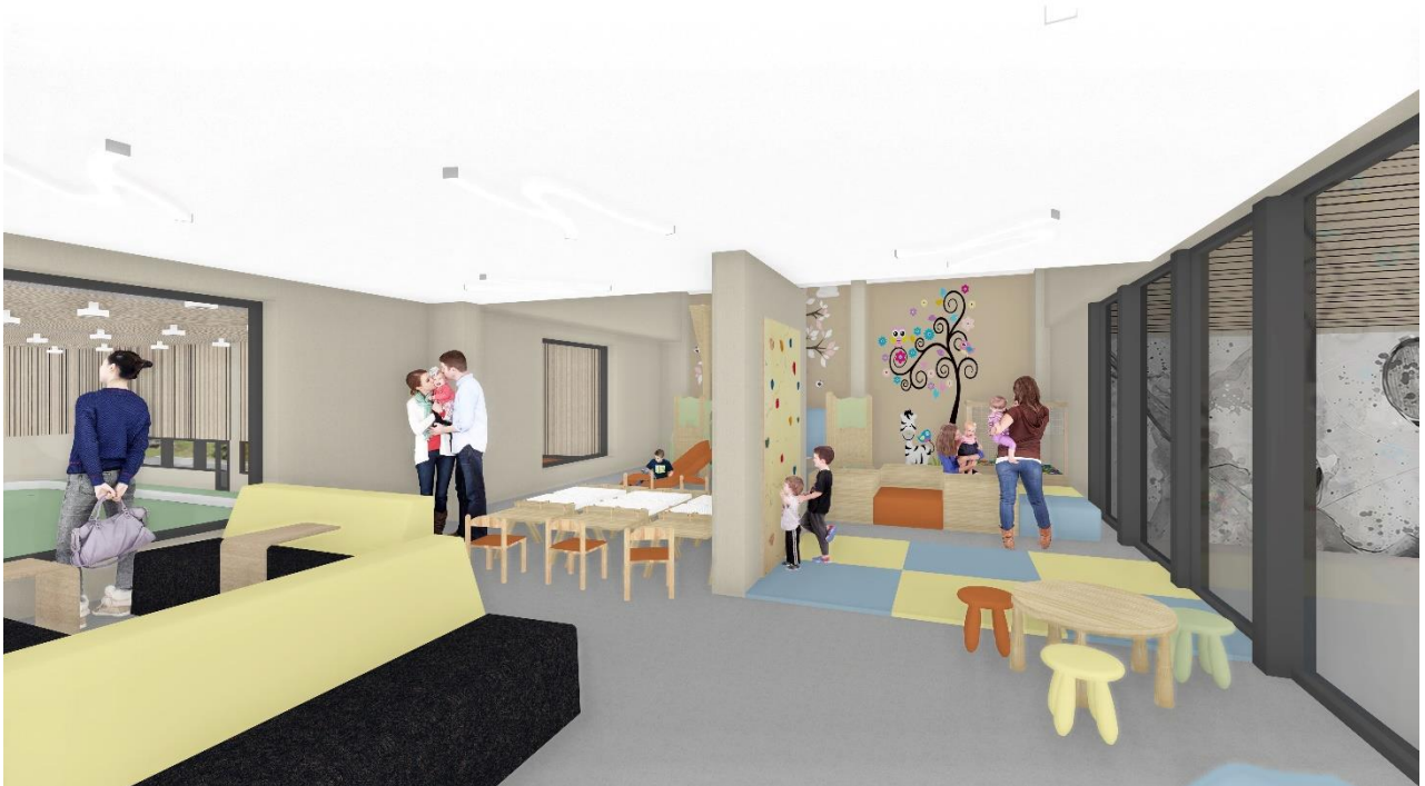
Antieriura caffetteria vegn nezegiada da niev per differentas purschidas per affons.

L'antieriura caffetteria vegn midada en in spazi da giugs per affons pigns cun elements da sport, da divertiment e termagliar ni era pusseivladads d'esser creativs. Finamira ei da nezegiar il surpli d'altezia da quella stanza e porscher als affons ina vasta purschida. Entras beindrizzadas finiastras vesan ins tgei che capeta ella halla plurivalenta ed ella halla da tennis. Ina lounge dat lu era la pusseivladad als geniturs da star ensemen e dar ina paterlada durant ch'ils affons fan termagls.