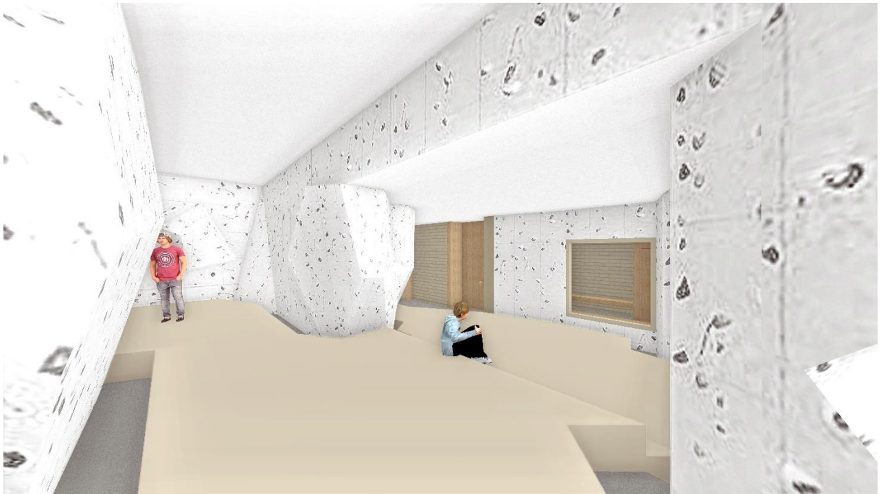
La nova halla da bouldrar cun differents nivels da grevezia.