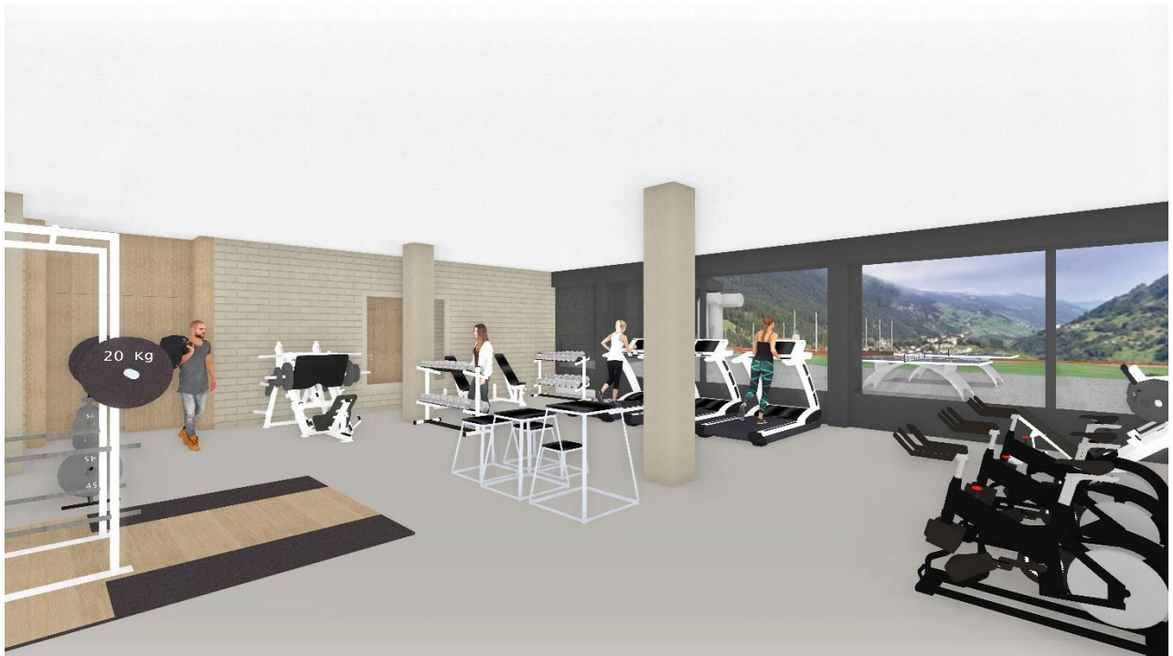
La stanza da fitness daventa pli spaziusa ed attractiva.

Il spazi sut la halla da tennis (actualmein nezegiaus sco magasin pil CSC, ulteriur plaz ei affittaus transitoriamein a privats per metter sut tetg vehichels) vegn egl avegnir a porscher ulteriura surfatscha per activitads da sport. Aschia dat ei ina stanza da fitness pli gronda che vegn posiziunada encunter ost cun grondas finiastras. Quei augmenta la qualidad ed attractividad dalla stanza da fitness en cumparegliaziun cul local actual.