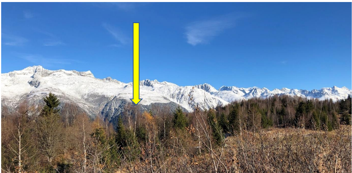
L'Alp Run ord vesta da Stagias

Nus quintein cun in recav d'electricitad regenerabel da ca. 45 entochen 50 GWh per onn pigl implont fotovoltaic all'Alp Run. Quei corrispunda al basegns d'electricitad da 9'000 entochen 10'000 casadas mesaunas.