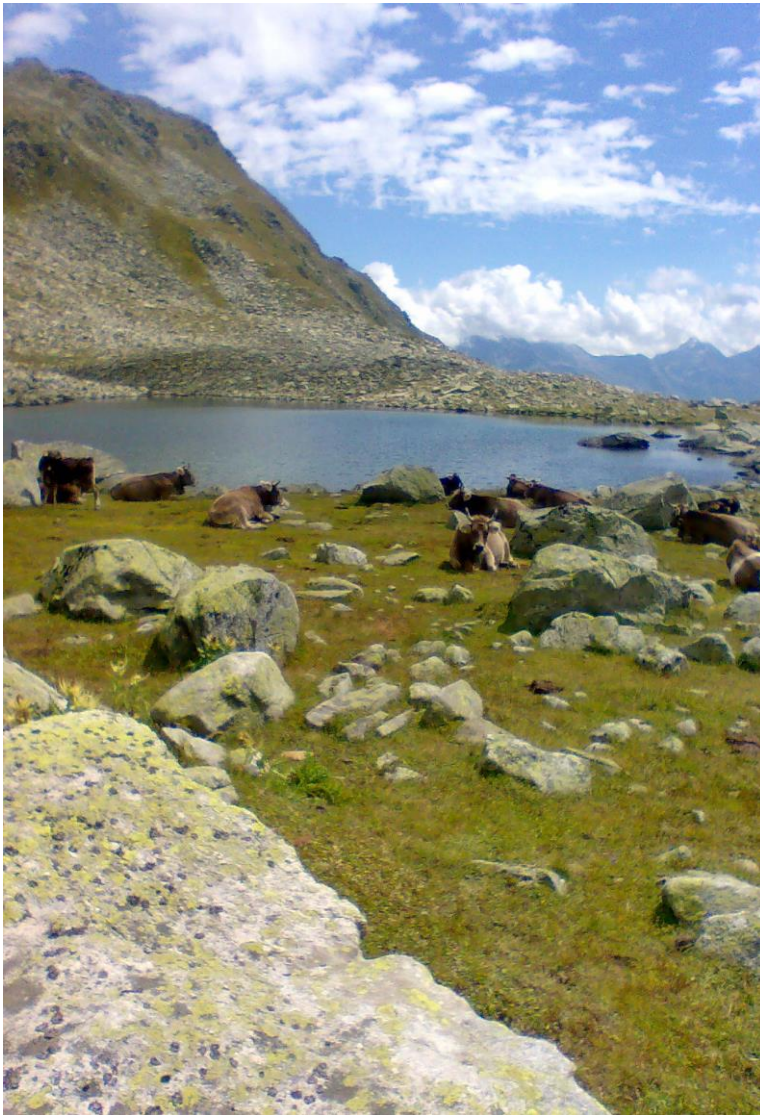
La muntanera da biestga sper il Lag Brit

Igl onn 1947 ei vegniu realisau a Mustér il lag da fermada a Barcuns. Ils onns 1962 - 1968 ein ils lags da fermada S. Maria, Nalps e Curnera vegni erigi. A siu temps ein ils possessurs da terren stai avon la decisiun da secunvegnir culs interessents ni da schar expropriar lur possess. Oz ein quellas impurtontas ovras hidraulicas en possess dall'Axpo Hydro Surselva SA. Quella societad appartegn all'Axpo e sa realisar oz grondas ovras solaras el liug dils lags da fermada senza indemnisar a nus indigens il rap solar.