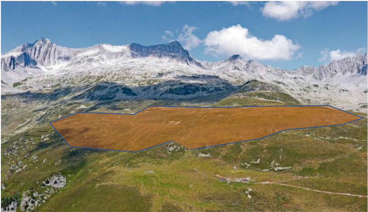
Visiun: Sin 35 hectaras in implont fotovoltaic, la grondezia da 50 plazs da ballapei

Indrezs installai sco menziunau produceschan durant il miez onn d'unviern circa treis entochen quater gadas dapli energia en cumparegliazion cun indrezs ella Bassa nua che la pendenza dils indrezs ei pusseivla cun 30°. Ils loghens alpins han aschia in fetg grond avantatg enviers loghens ella Bassa, il qual duei vegnir nezegiaus.